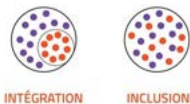
Schéma explicite proposé par l'association Toupi :

Un partenariat avec les acteurs locaux de ce secteur tel que l'association HAND'AVANT, plateforme pour l'organisation et la mise en place de l'accueil dans le cadre d'un protocole partagé.